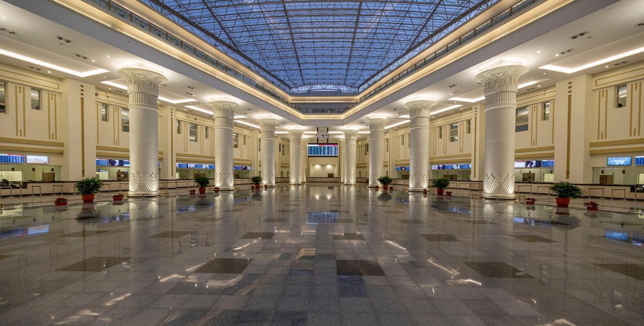
Upper Egypt Railway Station (Bashteel Station)